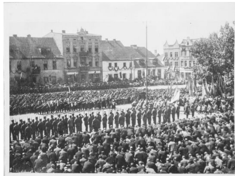
Vereidigung der Volkswehr des Landkreises Września am 25.5.1919 auf dem Marktplatz in Września