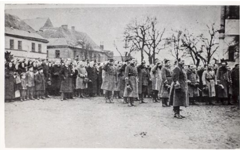
Feldgottesdienst auf dem Marktplatz in Zbąszyń (17.1.1920)