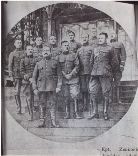
Stab des V. Militärischen Bezirks in Grodzisk