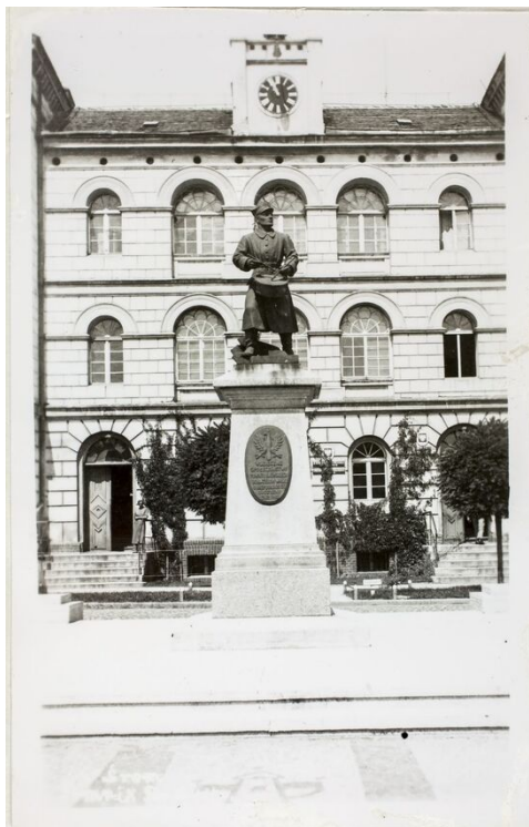
Das Denkmal der großpolnischen Aufständischen, welches auf dem Marktplatz in Sremie vor 1939 stand