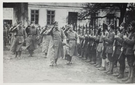
Begrüßung der Polnischen Armee durch General Józef Dowbor-Muśnicki