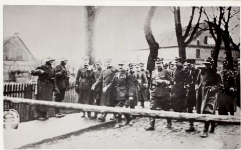
Polnische Armee am Grenzpunkt bei Zbąszyń