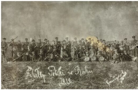
Pfadfinder (Buk 1919)