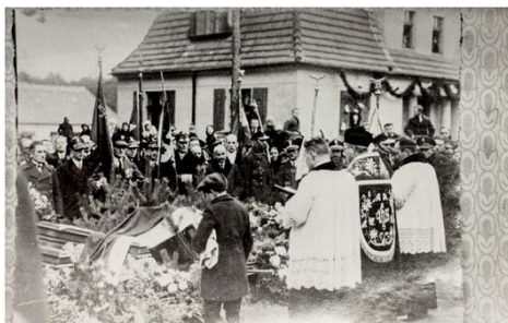
Abholung der sterblichen Überreste der Aufständischen an der polnisch-deutschen Grenze