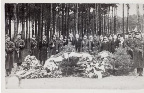
Ehrenwache vor den Särgen der großpolnischen Aufständischen