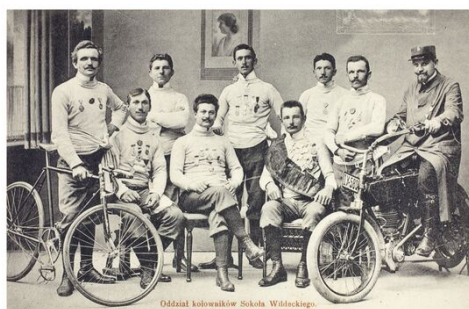
Oddział kolarników Sokola Wildeckiego.