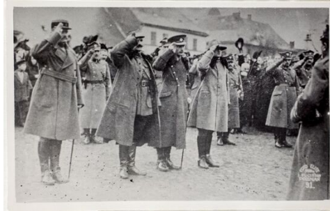
Offiziere der Koalitionsmission in Zbąszyń