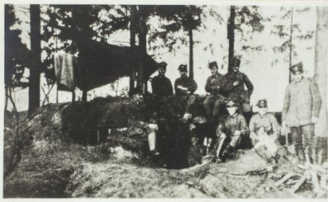
Eine Stelle der Aufständischen in Ofelia bei Margonin