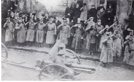
Defilee in Zbąszyń