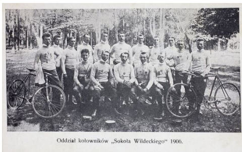
Oddział kolarników „Sokola Wildeckiego” 1906.