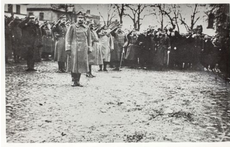
General Józef Dowbor-Muśnicki auf dem Marktplatz in Zbąszyń