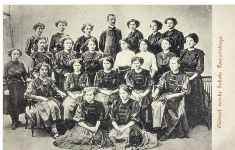
Oddział sokół Sokola Wildeckiego.