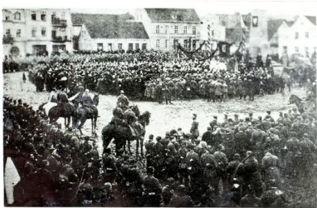
Empfang des 7. Großpolnischen Schützen-Regiments auf dem Marktplatz in Chodzież