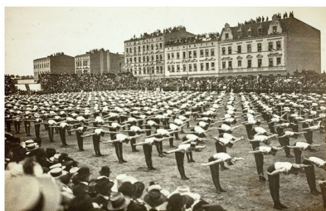
Turnverein „Sokół” Berlin