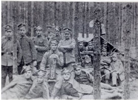
Polnische Armee bei Zbąszyń (Mai 1919)