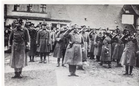
Stab von General Dowbor-Muśnicki und die Alliierten-