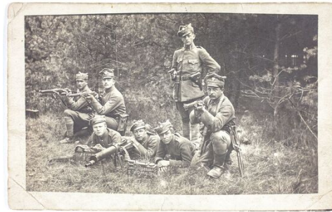
Eine Gruppe von Soldaten der 8. Kompanie des 9. Großpolnischen Schützen-Regiments (1919)