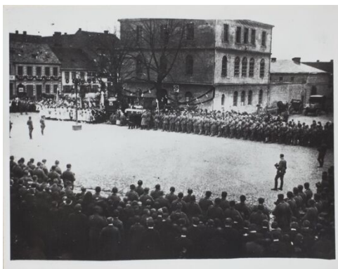
Vereidigung der Aufständischen auf dem Marktplatz in Jutrosin