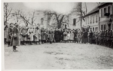
Feldgottesdienst auf dem Marktplatz in Zbąszyń (17.1.1920)